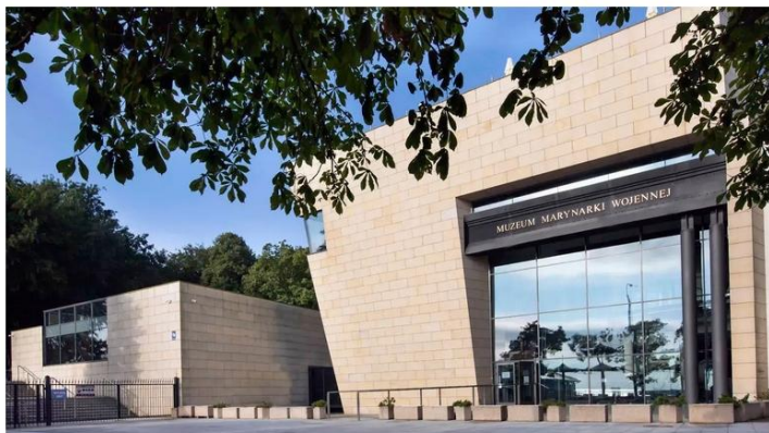
Muzeum Marynarki Wojennej (ul. Zawiszy Czarnego 1b)

Uczestnicy uroczystości w dniu 08.05.2026 na hasło „Bractwo Kurkowe” będą mogli nieodpłatnie zwiedzać gdyńskie muzea w godzinach ich otwarcia: