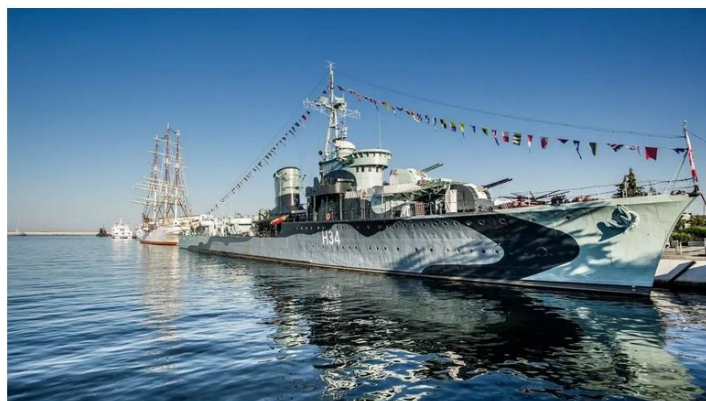
ORP Błyskawica (Al. Jana Pawła II 1)