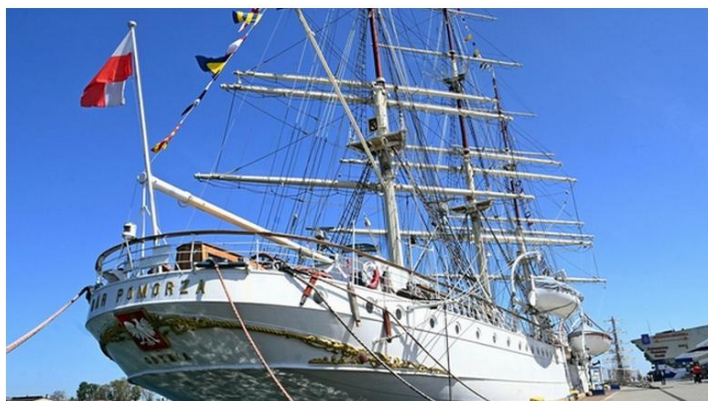
Dar Pomorza (Al. Jana Pawła II 1)