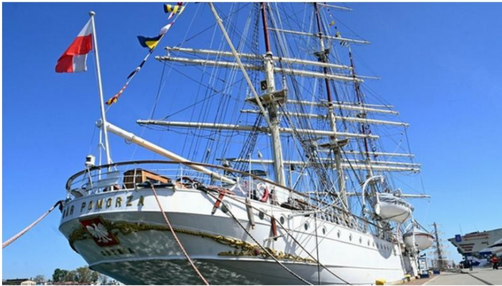
Dar Pomorza (Al. Jana Pawła II 1)