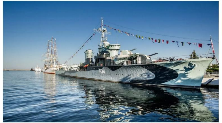
ORP Błyskawica (Al. Jana Pawła II 1)