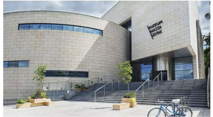
Muzeum Miasta Gdyni (ul. Zawiszy Czarnego 1)