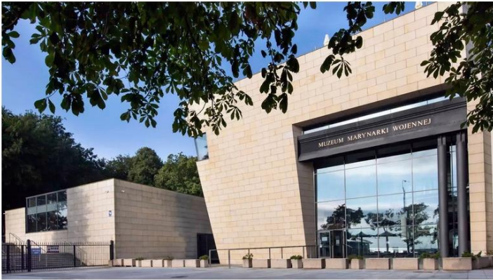
Muzeum Marynarki Wojennej (ul. Zawiszy Czarnego 1b)

Uczestnicy uroczystości w dniu 08.05.2026 na hasło „Kurkowe Bractwo Strzeleckie” będą mogli nieodpłatnie zwiedzać gdyńskie muzea w godzinach ich otwarcia: